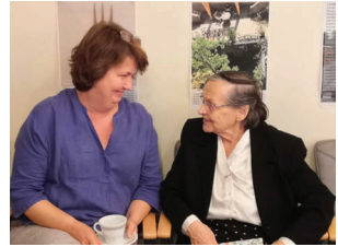
Von oben rechts (nach unten rechts) Beim Sommerfest in der Mariengemeinde, "Gemeinde unterwegs" in der Nähe der Bank of England, Oktoberfest in der Bonhoefferkirche