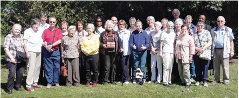
Oben: Gruppenbild von der Gemeindefreizeit in Heigh Leigh 2018 Links: Teilnehmende bei der Arbeit auf der Gemeindefreizeit