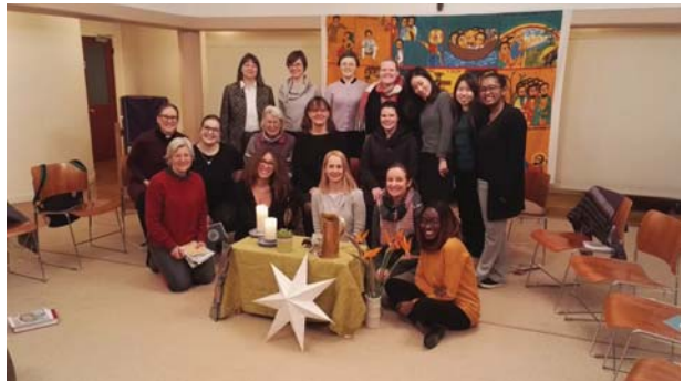
Oben: Gruppenbild beim Womens World Day of Prayer