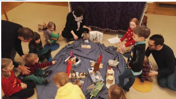
Links: Beim Familien- nachmittag rund um den Propheten Jona