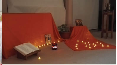
Links: Impression von den Adventsbasen Oben: Taize-Gebet