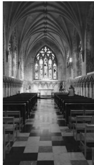
Lady's Chapel St Albans Cathedral