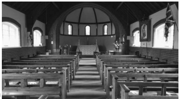
Presentation Church, Haywards Heath